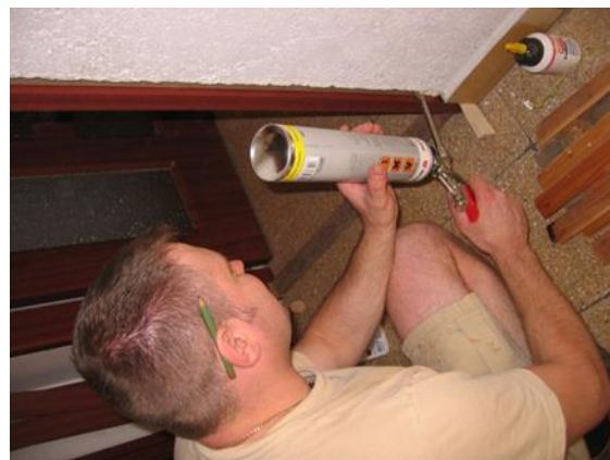
Ha a beállítás megtörtént, rögzítjük az utólag beépíthető ajtótokot PUR habbal. Azért hogy a hab, ne nyomja be a tokot, a padló vonalában és kb. 1 m magasan az ajtónyílásba tegyünk távtartót.