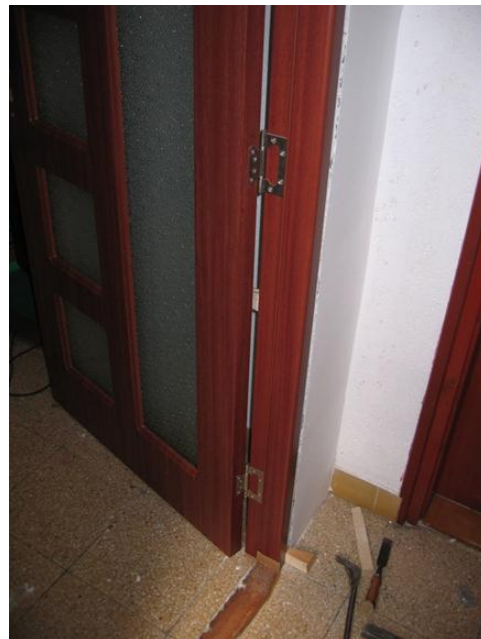
A az alsó, és a felső zsanért az ajtólap szélétől 20-20cm távolságra, a középsőt az ajtólap közepére helyezük.