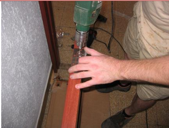
1. Az ajtózsanérokat (ajtónként 3 db) íves oldalukkal az élére fektetett ajtólapra rögzítjük.