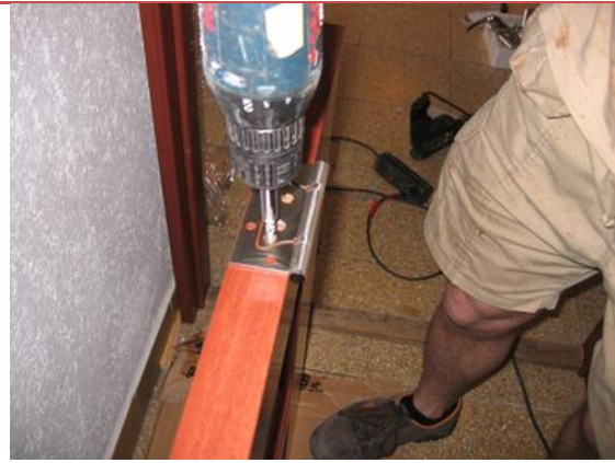
A zsanérok megfelelő oldalra történő felcsavarásával dönthetjük el a helyszínen, hogy az ajtó jobbos, vagy balos kivitelű legyen a beltéri ajtó..