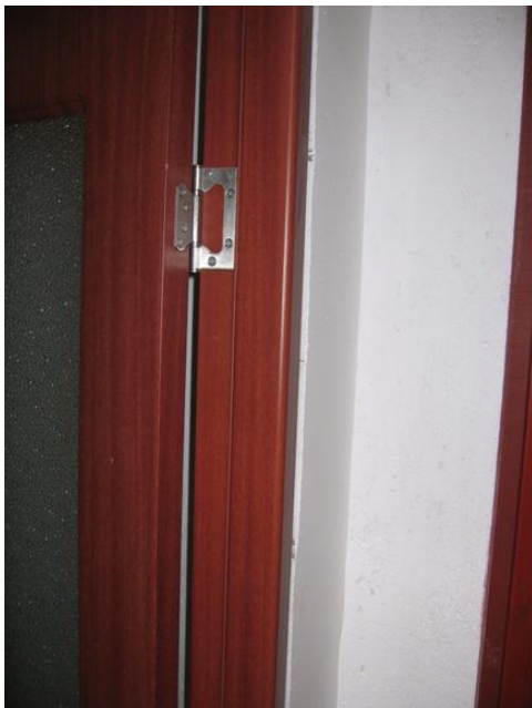
Rögzítjük az ajtólapot a tokon a mellékelt csavarokkal, a zsanér szögletes fele kerüljön a tokra.